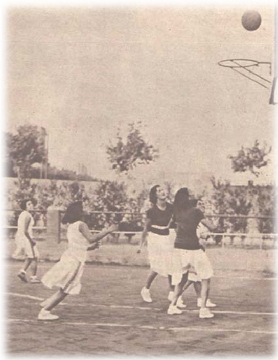
Ilustración 8: Un momento del partido jugado por los equipos del Layeta FC y el Barcelona FC.