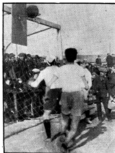
Ilustración 1: Primer partido de baloncesto.

El consenso historicista sostiene que la primera asociación fue el Laietà Basket, Club fundado por Ricardo Pardiña y Eusebio Millán en 1922. Esta entidad disputó el primer partido oficial reconocido entre el Laietà Basket Club y el CD Europa el 8 de diciembre de 1922 (Delegación Nacional de Deportes, 1954; Puyalto y Navarro, 2000; Valserra, 1944). [Ilustración 1]. Al cabo de unos pocos meses, el 15 de abril de 1923, ocho equipos disputaron en el Estadio de Montjuic el Primer Campeonato de Cataluña –también reconocido como primer campeonato nacional–. [Ilustración 2] Estos equipos fueron constituidos principalmente por colegiales de los padres escolapios y de las escuelas francesas (Espín, et al., 1985b). El campeonato fue ganado por La Patrie –equipo de las escuelas